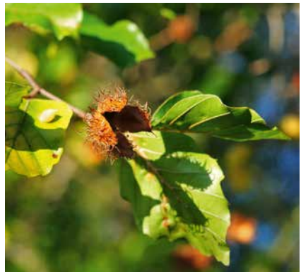
Buchenlaub.