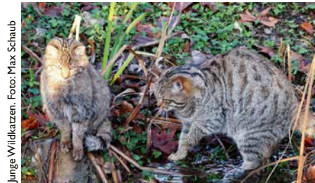
Junge Wildkatzen.

Nach einer ersten ruhigen Phase der Aufzucht galt es nach acht Wochen, die beiden verspielten Wildkätzchen einzufangen und zu untersuchen. Die Geschlechtsbestimmung ergab ein gemischtes Geschwisterpaar, also ein männliches und ein weibliches Tier. Bei beiden Tieren wurde der Gesundheitszustand beurteilt sowie eine erste Impfung gemacht. Daneben galt es, die jungen Tiere mit einem Chip zu versehen und sowohl zu entwurmen als