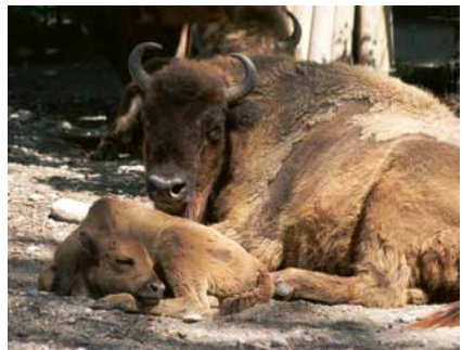
Wisentkuh Luba mit Baika.

hatte, welcher behandelt werden musste. Da es schon warm war und die Fliegenplage bereits begonnen hatte, entschlossen wir uns, den Abszess zu eröffnen, auszukratzen, zu spülen und die Haut wieder zu verschliessen. Eine grossflächige Entfernung der veränderten Haut hätte unweigerlich zur Ablage von Fliegenmaden geführt, was fatale Folgen gehabt hätte. Neben der Behandlung der Eiteransammlung konnte auch Blut entnommen und untersucht werden. Die Resultate der Blutuntersuchung waren zufriedenstellend und gaben wichtige Hinweise für eine mögliche Optimierung der Haltung und Fütterung. Während der Narikose konnte ebenfalls eine Ultraschalluntersuchung durchgeführt werden, welche zeigte, dass Luba trächtig war. Ende Juni war es dann soweit und das weibliche Wisentkalb Baika entwickelt sich seit seiner Geburt prächtig. Die Wisentkuh Luba kümmert sich fürsorglich um ihr Kalb und auch die Herde akzeptiert den Nachwuchs einwandfrei.