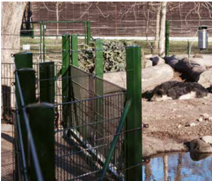
Neue Zäune im Erlebnishof.

2019 wurden nun die letzten Zäune bei den Wollschweinen und den Zwergziegen ersetzt. Ausserdem wurden die Tore beim Durchgangsweg durch das Zwergziegegehege optimiert und mit einer Sicherheitsschleuse versehen. Dieses Gesamtprojekt konnte nur dank grosszügiger Unterstützung von privaten Spendenden und Stiftungen realisiert werden, wofür wir uns herzlich bedanken! Die neuen Zäune entsprechen unserem Gesamtbild und werden sicher für die nächsten Jahrzehnte Bestand haben.