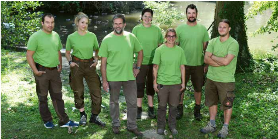
Das Tierpflegeteam.