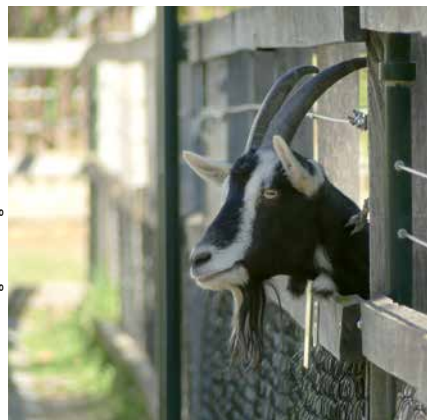
Bündner Strahlenziege.

worden, da die Schafe das krankheitsverursachende Herpesvirus in sich trugen. Die Ziegen im Park wurden damals ebenfalls auf das Schafherpesvirus untersucht und seit Langem wurde erfolglos ein Bock ohne dieses Virus für die Belegung der Bündner Strahlenziegen gesucht. Bei den Zwergziegen leistet der vom Zoo Basel stammende Zwergziegenbock Stöpsel seit seiner Eingliederung wunderbare Dienste. Stetig sorgt er zweimal jährlich bei den vier Zwergziegendamen für Nachwuchs. Im Frühjahr musste bei einer Zwergziege ein Kaiserschnitt vorgenommen werden, weil sie die Niederkunft nicht selber schaffte. Da bis Anfang 2019 kein geeigneter Strah-